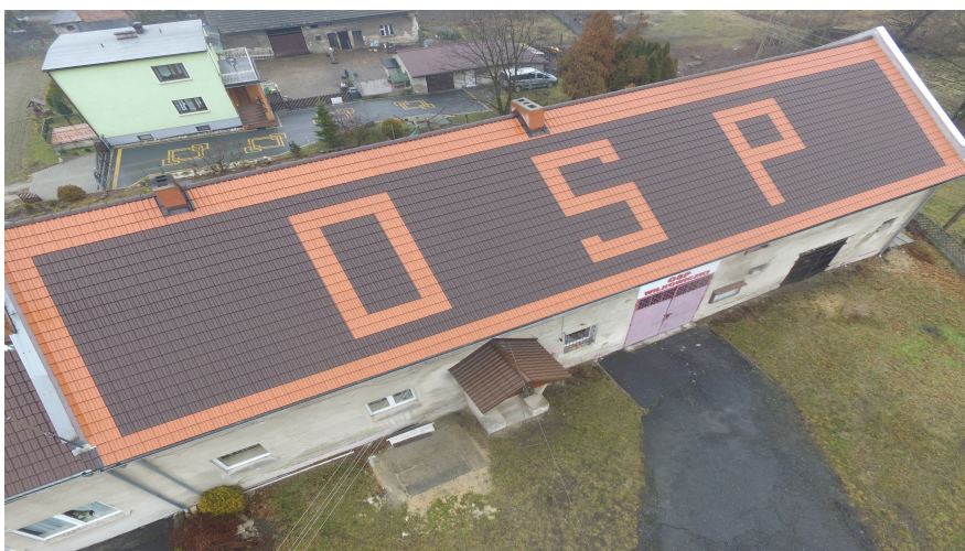
Zdjęcie 1. Stan obecny pokrycia dachowego